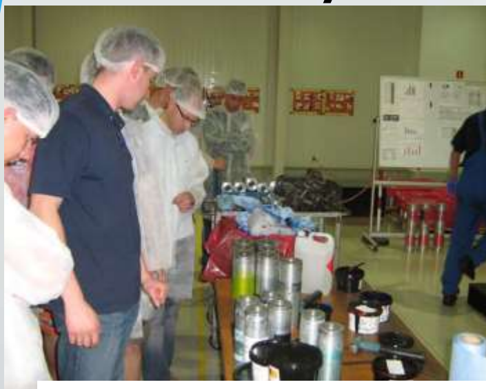
Essel Propack Polska