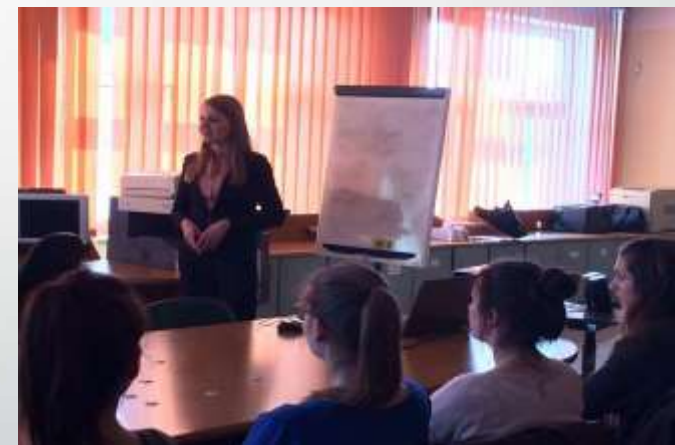
EMSKA Studio Reklamy