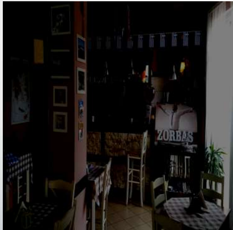
Restauracja Grecka Grill- Bar Zorbias