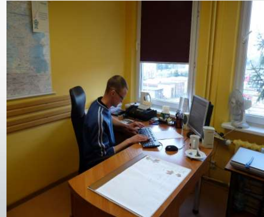
PCPR- Starostwo Międzyrzecz